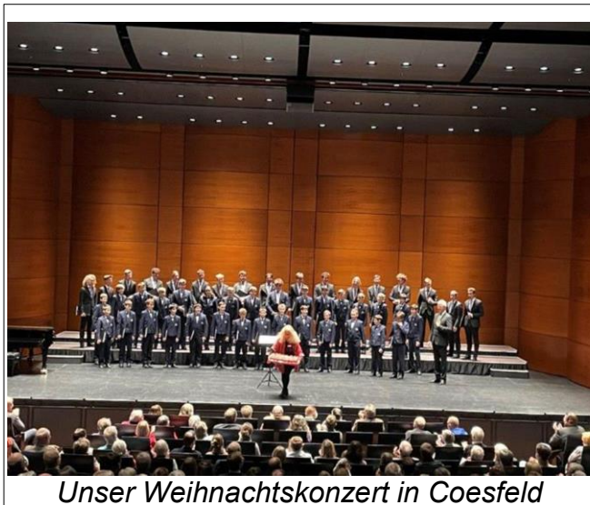
Unser Weihnachtskonzert in Coesfeld