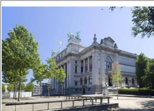
Koninklijk Museum voor Schone Kunsten KMSKA