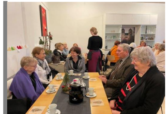
Kaffee im Kloster Gerleve