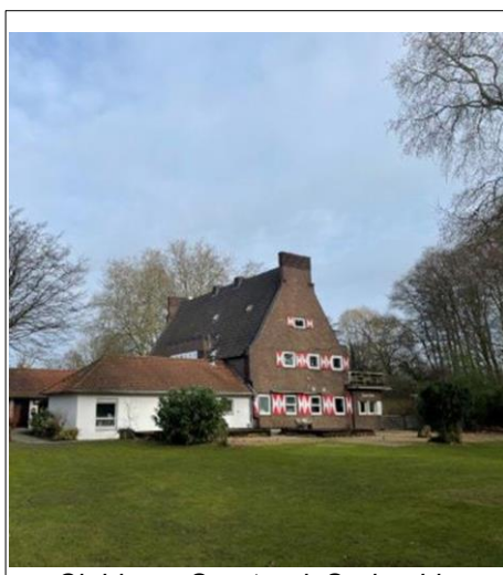
Clubhaus Sportpark Sudmühle

Deshalb laden wir nach schwierigen Zeiten in die idyllisch gelegene barocke Dyckburg-Kirche ein.