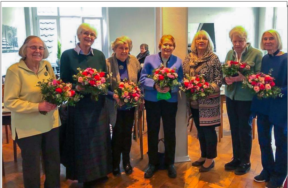
Ehrung langjähriger Mitglieder

Konto Frau und Kultur Gruppe Münster e. V. Sparkasse Münsterland Ost IBAN DE 58 4005 0150 0000 139 956