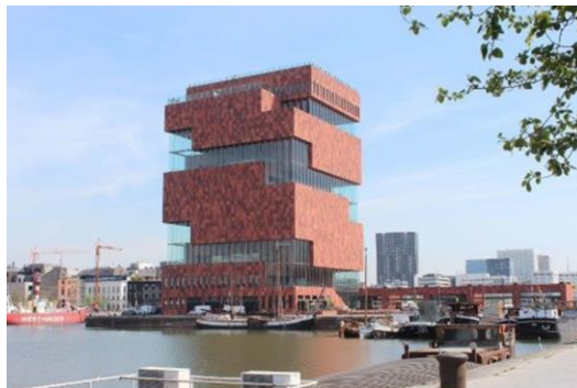
MAS Museum aan de Stroom