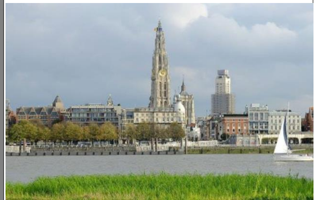
Liebfrauenkathedrale (Onze-Lieve- Vrouwekathedraal)

Preis pro Person im Doppelzimmer: 540,00 Euro