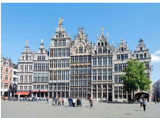
Gildehäuser am Großen Markt

Abends: Gemeinsames Diner im Zentrum der Stadt.