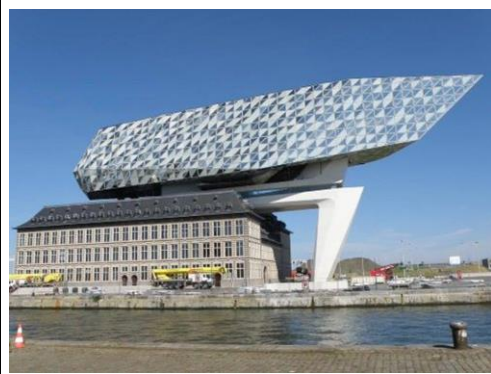
Port House/Havenhuis (Neubau von Zaha Hadid)