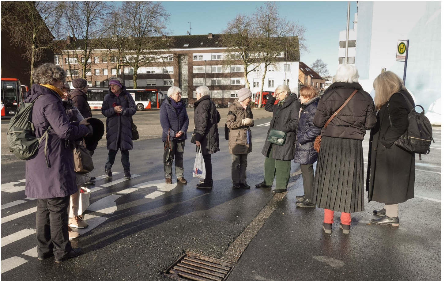
Tagesausflug 15. März 2023 nach Winterswijk mit Besuch Villa Mondriaan